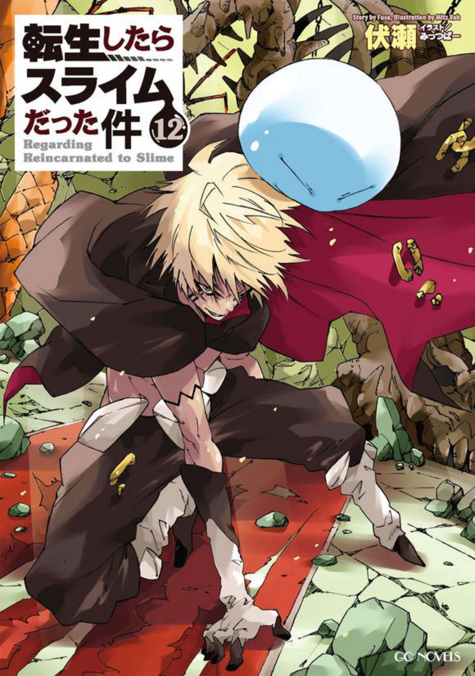
イラスト みつばー